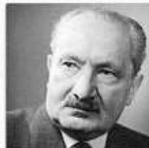
Martin Heidegger 1889–1976