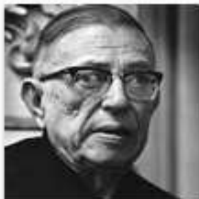
Jean-Paul Sartre 1905–1980