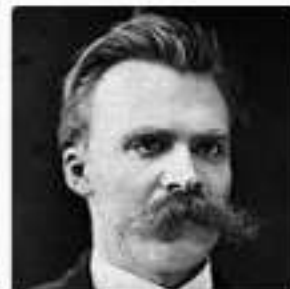
Friedrich Nietzsche 1844–1900