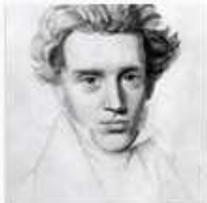
Søren Kierkegaard 1813–1855