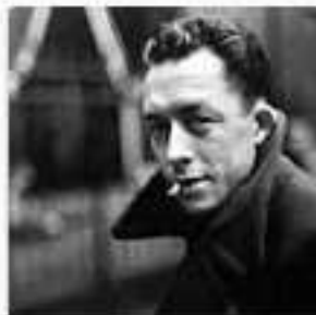
Albert Camus 1913–1960